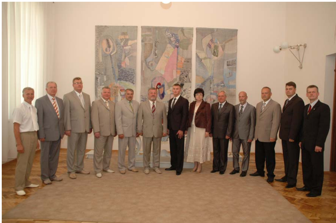
1.attēls. Jēkabpils pilsētas domes deputāti

Jēkabpils pilsētas iedzīvotāju intereses domē pārstāv 13 deputāti, kurus ievēl uz 4 gadiem, pēdējās vēlēšanas notika 2009.gada jūnijā. Domē pārstāvētas 7 partijas: partija „LPP/LC” (4 vietas), partija Jaunais laiks (2 vietas), politisko partiju apvienība ”Saskaņas Centrs” (2 vietas), Latvijas zaļā partija (2 vietas), ”Tautas partija” (1 vieta), centriskā partija Latvijas Zemnieku savienība (1 vieta), un partija PCTVL ”Par cilvēka tiesībām vienotā Latvijā” (1 vieta).