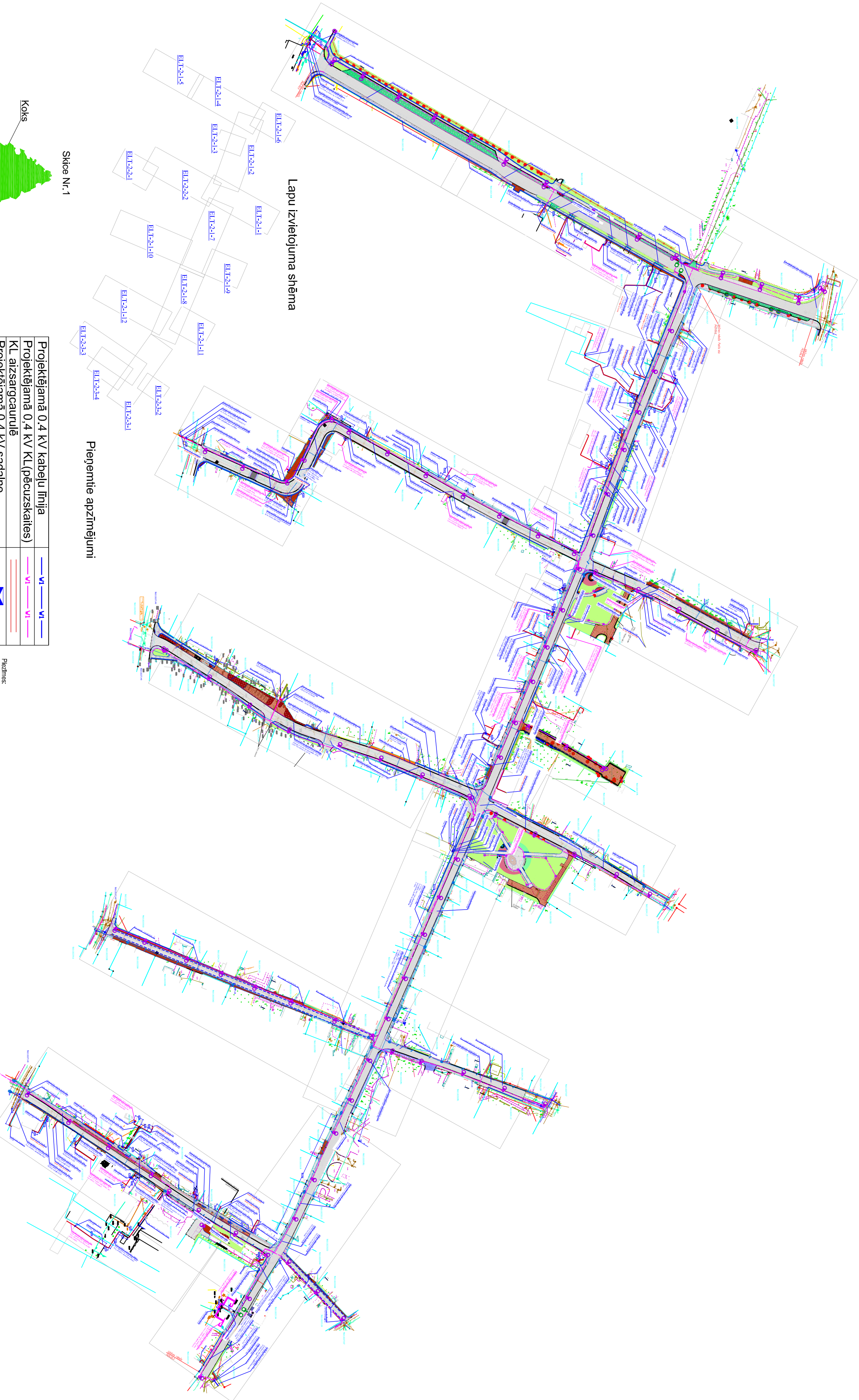
Lapu izvietojuma shēma