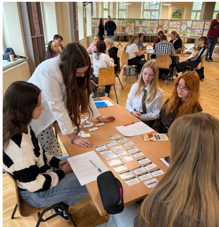
Līdzfinansē Eiropas Savienība. Šī publikācija atspoguļo vienīgi autora uzskatus un viedokli, un ne obligāti Eiropas Savienības, Eiropas Komisijas vai Valsts aģentūras (Jaunatnes starptautisko programmu aģentūras) viedokli, kuras nav atbildīgas par tajā ietvertās informācijas jebkādu izmantošanu.

Diena bija piepildīta ar jaunatniem, sarunām un vērtīgām atziņām. Viena no svarīgākajām atziņām – mums visiem ir jābūt komunikācijai, gan skaidri izteikt savu viedokli, gan dzirdēt un pieņemt citādu redzējumu, saglabājot spēju cieņpilni diskutēt.