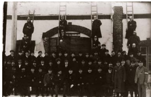
Jēkabpils brīvprātīgo ugunsdzēsēju biedrība. 20. gs. sākums