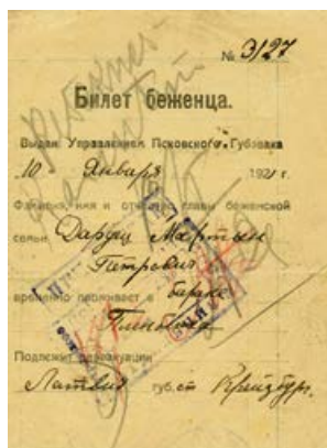
Bēgļa bijete, izdota Dardecim Mārtiņam Pētera d. izbraukšanai no Pleskavas uz Krustpili 1921. gada 10. janvārī