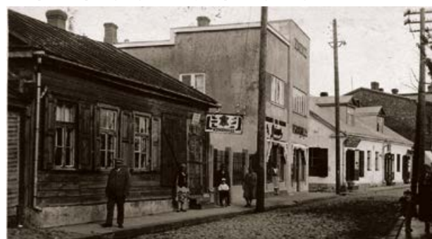
Brīvības iela, Jēkabpils. 20. gs. 20. gadi