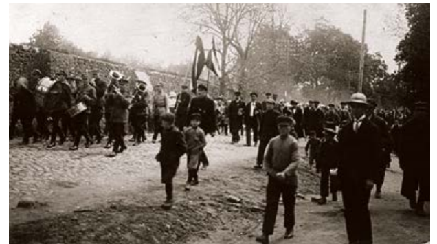
Gājiens pa Rīgas ielu. 20. gs. 20. gadi