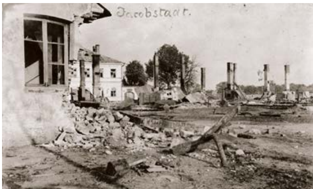
Jēkabpils pēc I pasaules kara. Brīvības iela