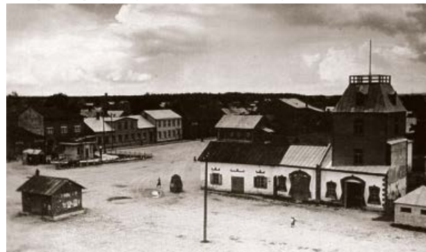
Jēkabpils Brīvprātīgo ugunsdzēsēju depo. 20. gs. 20. gadi