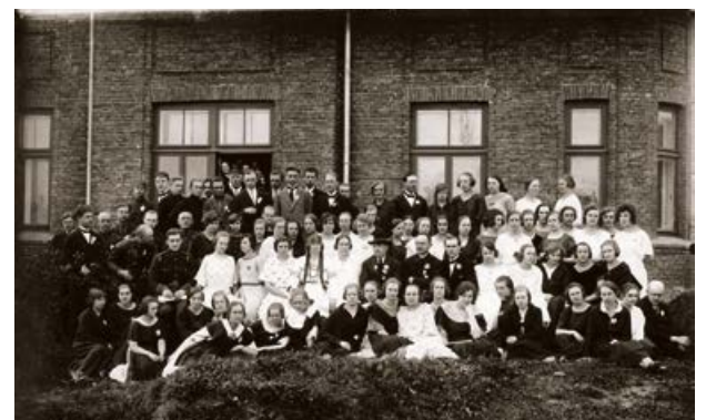
Jēkabpils Izglītības biedrības koris un Jēkabpils Valsts vidusskolas koris Jēkabpili Baltās puķes dienā. 1925. gada 10. maijā