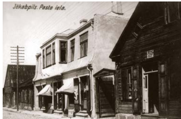
Pasta iela Jēkabpilī. 20. gs. 20. gadi