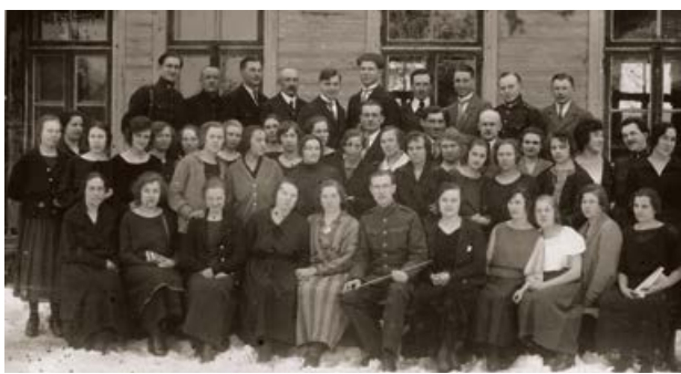
Jēkabpils Izglītības biedrības koris. 1925. gads