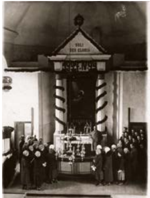
Jēkabpils ev. lut. baznīca. 1927. gada 24. aprīlis