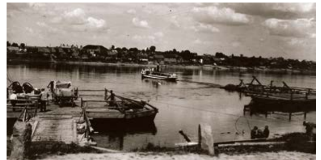
Pārvietošanās līdzekļi pār Daugavu starp Jēkabpili un Krustpili. 20. gs. 20. gadi.