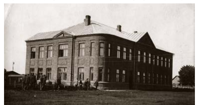
Jēkabpils Valsts vidusskola. 20. gs. 20. gadi