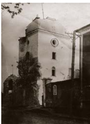
Krustpils pils. Pēc I pasaules kara