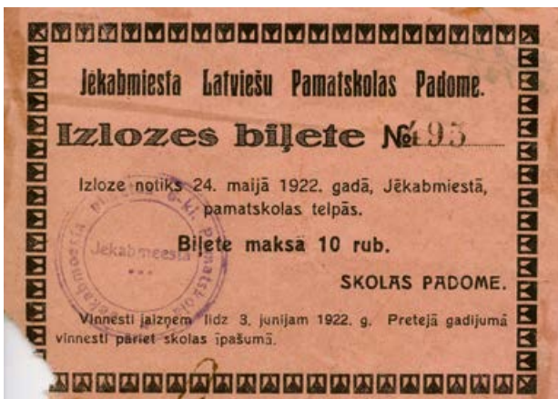
Jēkabmiesta Latviešu Pamatskolas Padomes izlozes bijete. 1922. gads