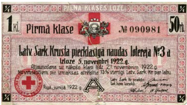
Latvijas Sarkanā Krusta pieklasīgā naudas loterijas bijete. 1922. gads