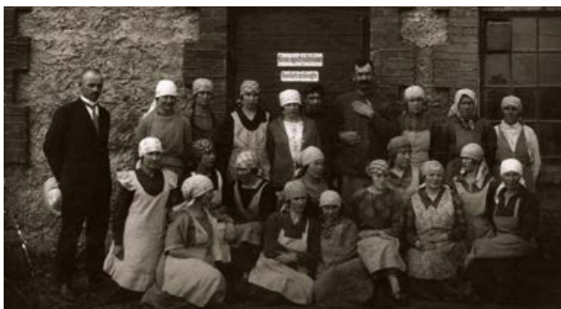
Brāļu Lesu tvaika dzirnavu un lina apstrādāšanas uzņēmuma darbinieki. 20. gs. 20. gadi