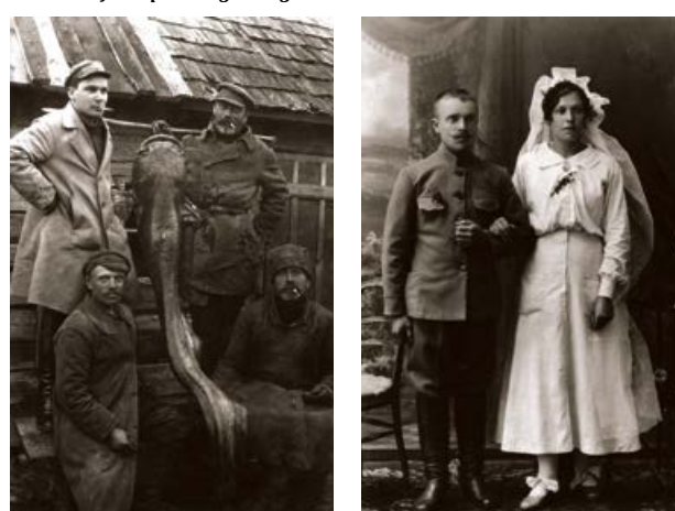
Krustpils plostnieki ar noķerto samu, Krasta ielā. 20. gs. 20. gadi