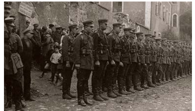
Latgales artilērijas pulka karavīri ierindā pie Krustpils pils. 20. gs. 20. gadi