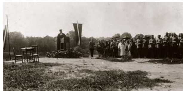
1925. gada 26. jūlijā Rīgas ielā tiek ielikts pieminekļa „Kritušiem par Tēviju 1918–1920” pamatakmens

Vēstule sūtīta no Krustpils uz Sunākstes pagastu Mērijai. Vēstulē saglabāta oriģinālā rakstība.