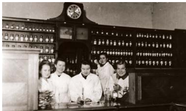
Jēkabpils aptiekas darbinieki. 1945. gads