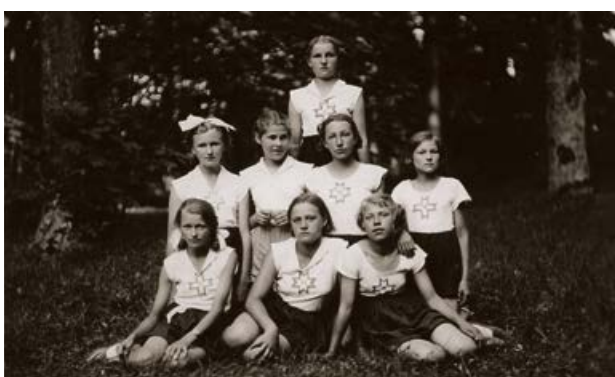
Krustpils Valsts sešklasīgās pamatskolas skolnieces sporta svētkos Krustpils pils parkā. 1938. gada 17. jūlijā