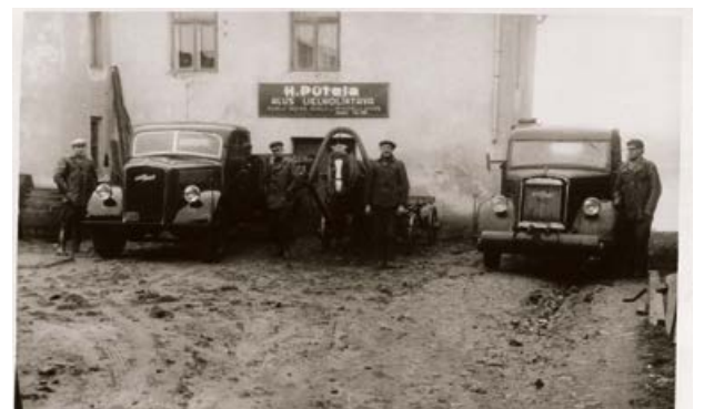
H. Pūteļa alus lielnoliktava, Krasta iela 34 (tagad Pļaviņu iela). 20. gs. 30. gadu beigās