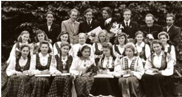
Jēkabpils komercskolas 1941. gada izlaidums