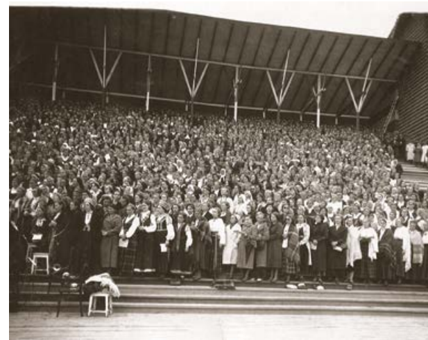
Latgales Dziesmu svētki, 1940. gada 15. – 16. jūnijs. Daugavpils

Izsūtīto līdzī paņemtais bija izdzīvošanas nosacījums vai mīļa atmiņa par dzimteni. Arī atgriežoties Latvijā, šos priekšmetus glabāja kā ģimenes relikvijas.