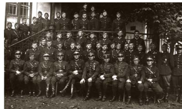
Latgales artilērijas pulks pie Krustpils pils. 1939. gads