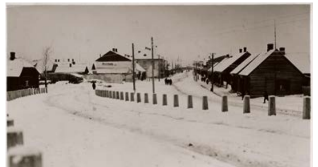
Skats no tilta nobrauktuves uz Rīgas ielu. 1938. gads