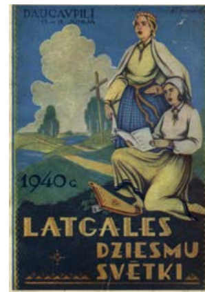
Latgales Dziesmu svētki, 1940. gada 15. – 16. jūnijs. Daugavpils