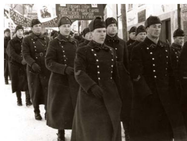
24. teritoriālā korpusa 183. strēlnieku divīzijas 623. artilērijas pulka kareivji, bijušie Latgales artilērijas pulka karavīri Cēsīs gājienā. 1941. gads