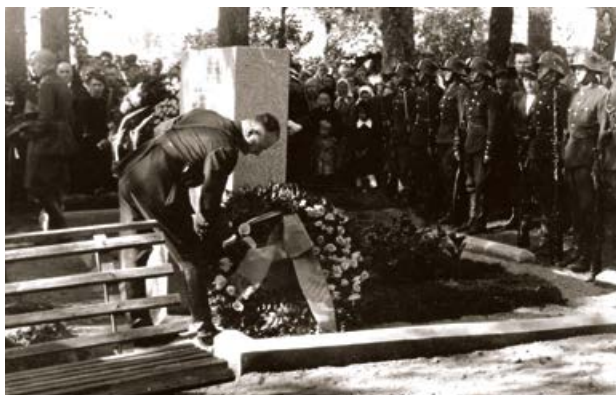
Pieminekļa atklāšana 1938. gada 30. septembrī

1937. gadā Latgales artilērijas pulks vērsās pie Brāļu kapu komitejas ar lūgumu izstrādāt pieminekļa projektu. Piemīņas zīmes projektu izstrādāja arhitekts V. Vitands, savukārt plāksnes veida pieminekli granītā izgatavoja E. Kuraua firmā. Sākotnēji pieminekļa dienvidu pusē zem uzraksta bijusi bronzā atlieta šautene un bruņucepure. Jau 1938. gada 30. septembrī ar Brīvības cīņu dalībnieku, Krustpils sabiedrības piedalīšanos un ar Latgales artilērijas pulka goda sardzi pieminekli iesvētīja. Uz pieminekļa ir izkalti vārdi: „Mēs mirām, lai Jūs dzīvotu”.