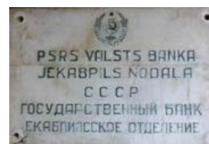
Latvijas Bankas Jēkabpils nodaļas plāksnes divas puses. 1940. gads