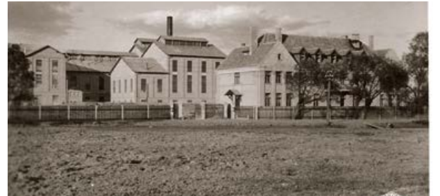
Skats uz Krustpils cukurfabriku. 1939. gads