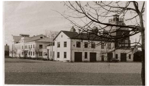
Jēkabpils Brīvprātīgo ugunsdzēsēju depo un Aizsargu nams. 20. gs. 30. gadu beigās