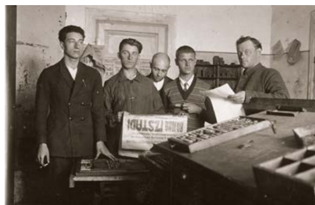
Jēkabpils drukātavas darbinieki. 20. gs. 30. gadu beigas