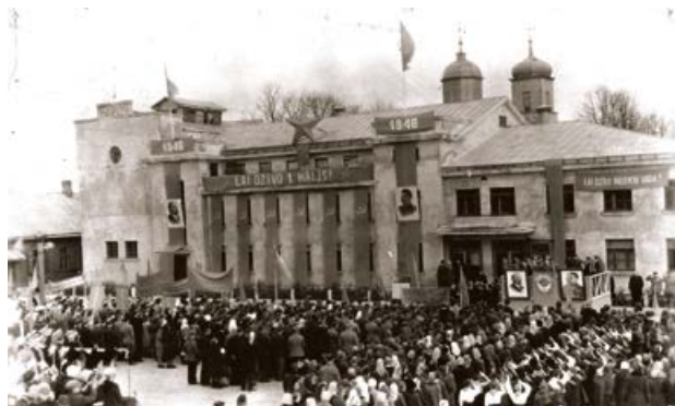
1. maija svētku demonstrācija Jēkabpilī pie kultūras nama. 1946. gads