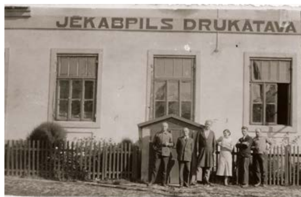
Jēkabpils drukātava. 20. gs. 30. gadu beigas