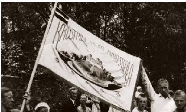
Krustpils Valsts sešklasīgās pamatskolas karoga iesvētīšana 1938. gada 14. jūnijā.