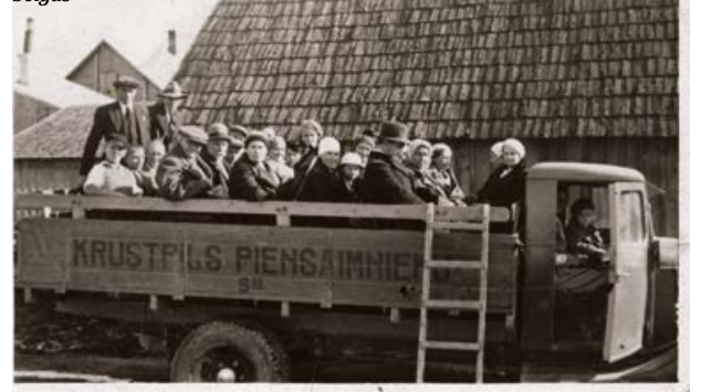
A/S „Krustpils piensaimnieku sabiedrība” darbinieki. 20. gs. 30. gadu beigās