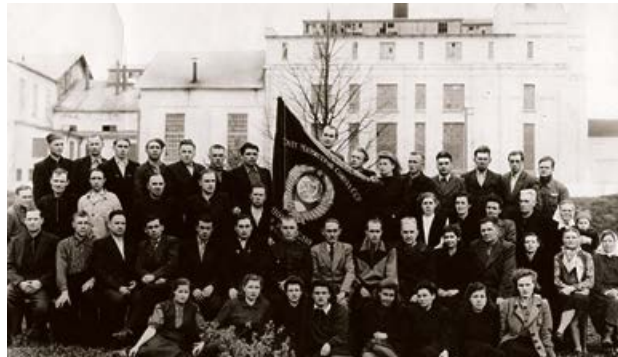
Krustpils cukurfabrika 1945. gadā saņem Vissavienības Ministru padomes ceļojošo sarkano karogu