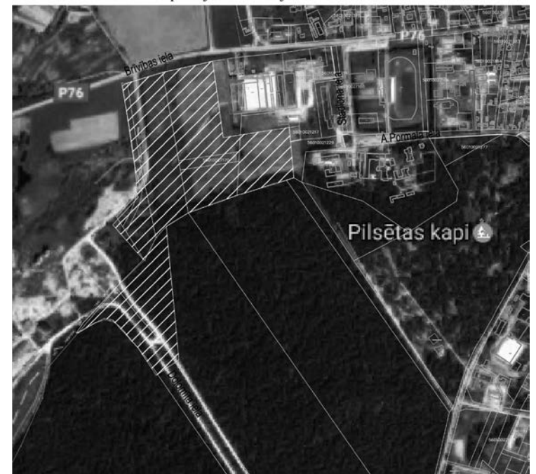
Detālplānojuma teritorijas atrašanās vieta

Detalizēta informācija – Jēkabpils pilsētas pašvaldības Būvniecības un komunālās saimniecības nodaļā Jaunā ielā 31C, Jēkabpilī, pašvaldības darba laikā.