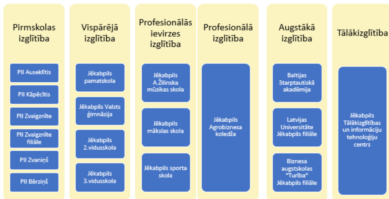
1.attēls. Izglītības iestādes Jēkabpilī

Jēkabpils pilsētā darbojas četrpadsmit pašvaldības izglītības iestādes – 5 pirmsskolas izglītības iestādes, 4 vispārīzglītojošās izglītības iestādes, 3 profesionālās ievirzes izglītības iestādes, 1 profesionālās izglītības iestāde, 3 augstākās izglītības filiāles un tālākizglītības centrs: